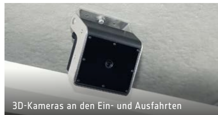
3D-Kameras an den Ein- und Ausfahrten

Einzelplatzerfassung mit Sensoren an jedem Stellplatz und LED-Anzeigen an jedem 2. Stellplatz (Erfassung mittels 3D-Kamera, falls oberste Ebene ohne Dach)