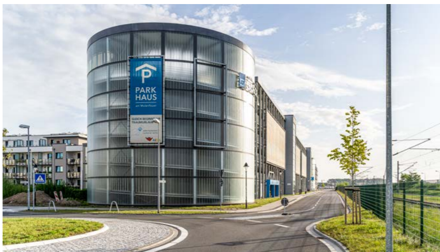
Parkhaus am Molenfeuer, 18119 Warnemünde mit 735 Stellplätzen