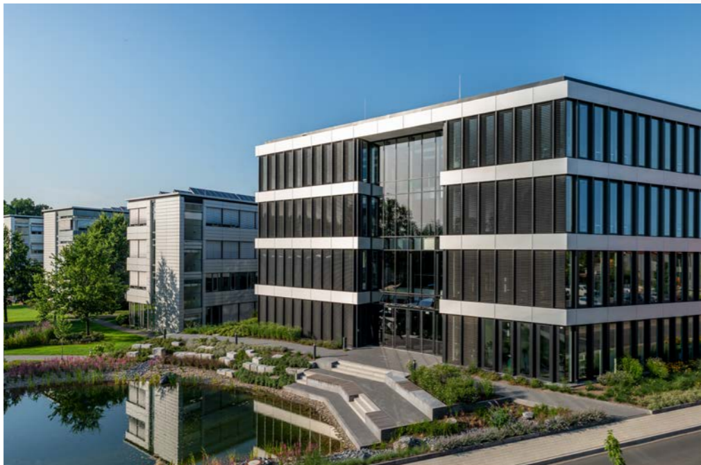
GOLDBECK Stammsitz in 33649 Bielefeld

GOLDBECK baut zukunftsweisende Gewerbeimmobilien in Europa. Gebäude verstehen wir als Produkte, die wir für unsere Kunden aus einer Hand realisieren: vom Design über die Erstellung bis zu Serviceleistungen während des Betriebs. Mit dem Anspruch „building excellence“ verwirklichen wir Immobilien wirtschaftlich, schnell und zuverlässig bei passgenauer Funktionalität. Ganzheitliche Planungskompetenz, die eigene industrielle Vorfertigung sowie führende Technologien sind die Erfolgsfaktoren für unser elementiertes Bauen mit System. Menschlichkeit, Verantwortung und Leistungsbereitschaft bilden die Wertebasis unseres Familienunternehmens. Lösungsorientierte GOLDBECKer begleiten unsere Kunden in regionalen Niederlassungen und handeln als Unternehmer vor Ort. Mit der Erfahrung aus über 10.000 Projekten, unserer Innovationsstärke und als Treiber der Digitalisierung stellen wir sicher, dass unsere Produkte während der Nutzung optimal funktionieren – Zukunftsfähigkeit inklusive.