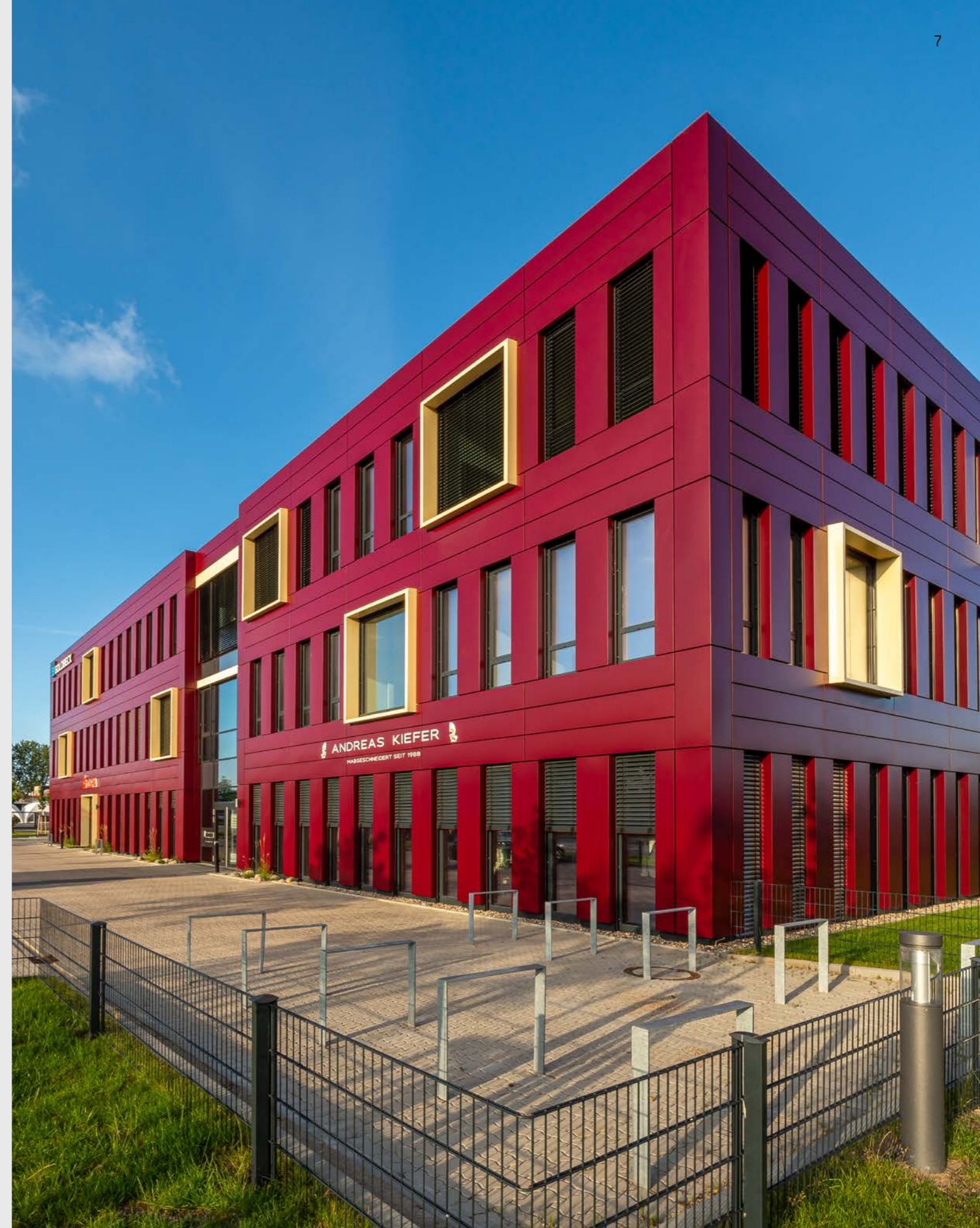
Enex Campus, 18055 Rostock, Bürogebäude mit 2.140 m 2 BGF (1. Bauabschnitt)