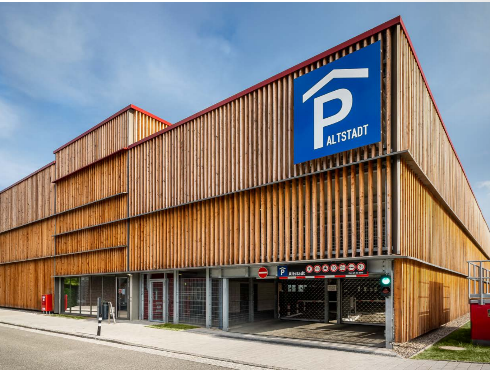
Parkhaus Altstadt, 18055 Rostock mit 260 Stellplätzen