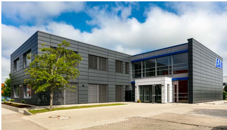
EAN, 17034 Neubrandenburg, Bürogebäude mit 1.100 m 2 BGF

GOLDBECK ist Partner für die mittelständische Wirtschaft, Großunternehmen, Investoren, Projektentwickler sowie öffentliche Auftraggeber. Zum Leistungsangebot gehören Logistik- und Industriehallen, Büro- und Schulgebäude, Sporthallen, Parkhäuser und Wohngebäude. Bauen im Bestand sowie gebäudenahe Serviceleistungen vervollständigen das Spektrum.