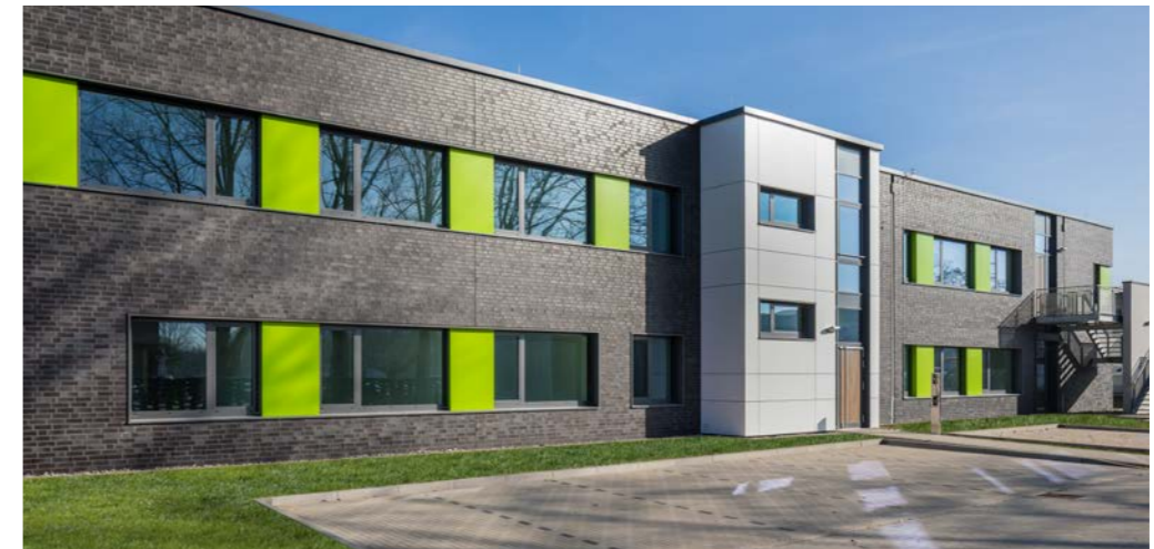
BBL Zollhaus, 18147 Rostock, Bürogebäude mit 1.000 m 2 BGF