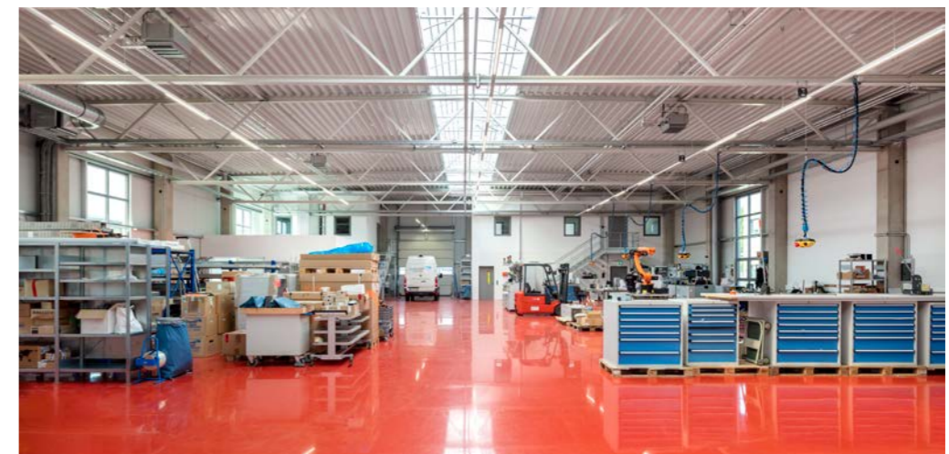
A&S, 17033 Neubrandenburg, Produktionshalle mit 1.100 m 2 und Bürogebäude mit 1.000 m 2 BGF