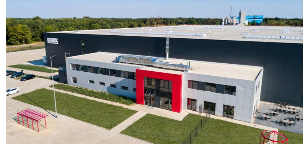
Fenix, 19288 Ludwigslust, Logistikhalle mit 30.000 m 2 und Bürogebäude mit 1.300 m 2 BGF