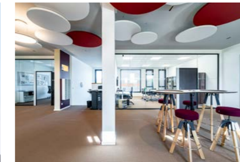
Die Niederlassung Rostock

„Wir realisieren zukunftsweisende Immobilien. Dabei ist gegenseitiges Vertrauen die Basis für eine erfolgreiche Zusammenarbeit. Überzeugen Sie sich von unserer Leistungsfähigkeit.“